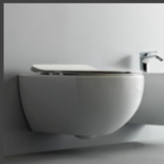
AlternA Arco hvit vegghengt toalett med sofflokk