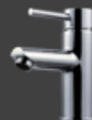
Tapwell SK071 krom Servantbatteri