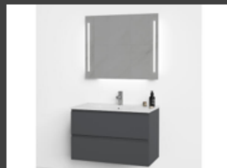
Viking bad Mie Servantskap, porselen vask og speil m/ leddlys