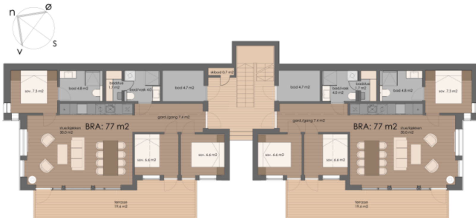
Lodge 3, leilighet L3.01