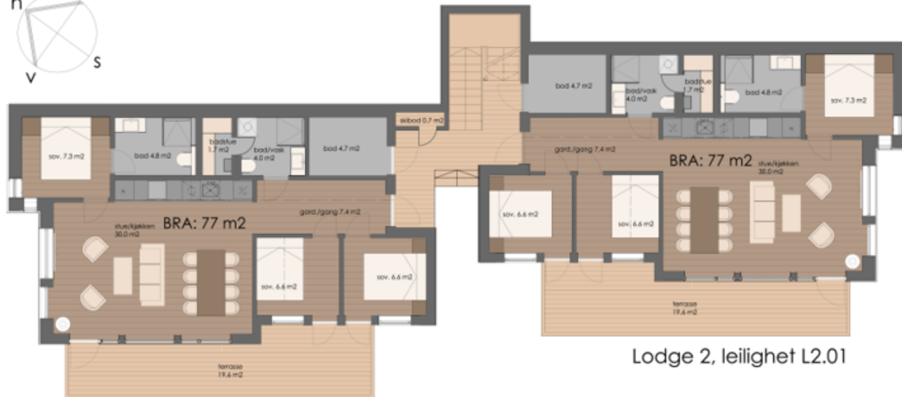
Lodge 1, leilighet L1.01