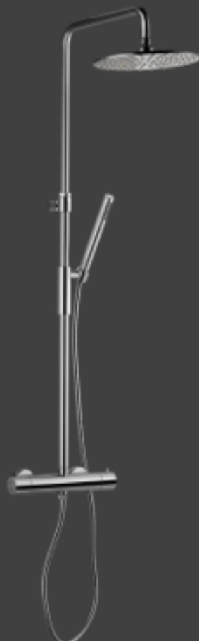
Tapwell TVM7200 krom Takdusj