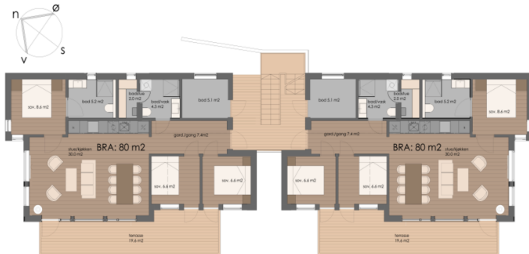
Lodge 3, leilighet L3.02