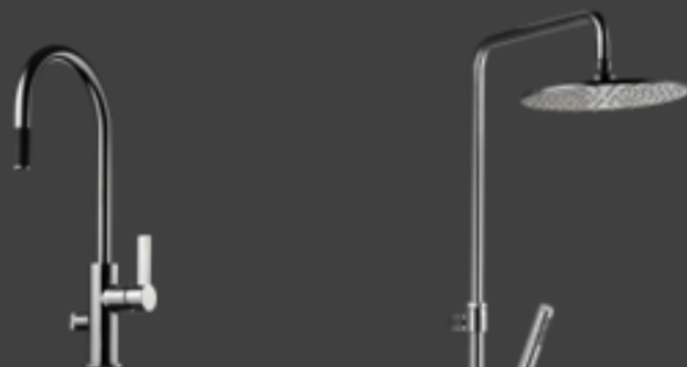
Tapwell ARM885 krom Kjøkkenkran m/uttrekk og avstenging